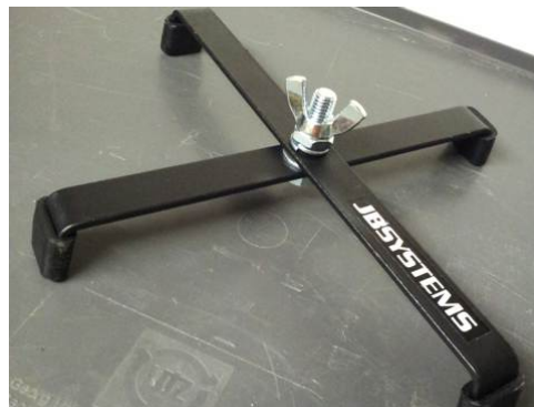
10 Bodenständer, flach zusammenlegbar