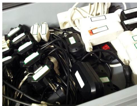
Mehrfachstecker, in Kisten verpackt

Stromkabel (12 / 10 / 5 / 3 Meter Länge), 2 Kabelrollen (30 / 25 Meter), Total über 480 Meter