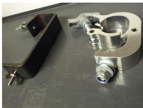
18 Clamps, versch. Typen